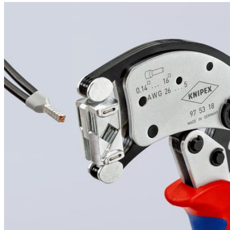
360° draibare krimpkop voor de beste toegankelijkheid ook in nauwe zones